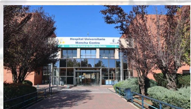
Hospital Universitario Mancha Centro Gerencia de Atención Integrada de Alcázar de San Juan